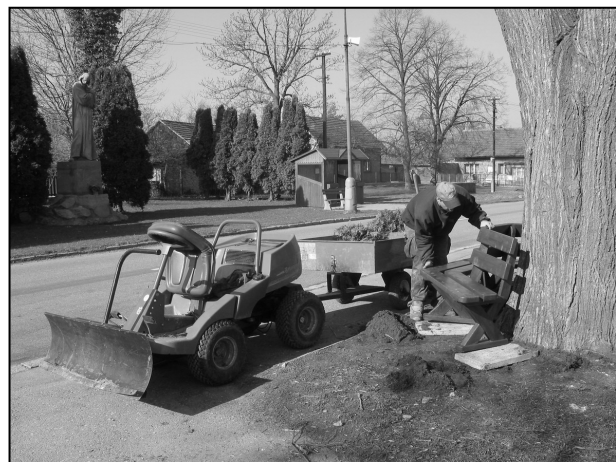
Maličkost pro zkrášlení obce, nová polokruhová lavička u lípy na autobusové zastávce u sochy M. J.Husa.

V odůvodnění se píše: Socha je provedena v nadživotní velikosti a byla zhotovena v roce 1912 sochařem Cyrilem Jurečkou v nedaleké Chocni na základě podnětu poslance, pozdějšího ministra obrany a senátora Václava Klofáče. Umístění obdobného díla ve venkovském prostředí je poměrně netypickým příkladem. Jedná se o dílo svým způsobem ojedinělé, vztahující se k místním kulturním událostem v Dobříkově a okolí v letech 1911 a 1912. Je upomínkou na 20.srpna 1911, kdy se z podnětu tehdejšího poslance V.Klofáče konal Tábor lidu, což bylo dostaveníčko pokrokově smýšlejících lidí z celého okresu Vysoké Mýto. Postava Mistra Jana Husa s mírně skloněnou hlavou, natočenou vpravo, je oděna v dlouhém splývavém a mírně zřaseném pláští. Pravou nohu má lehce nakročenou vpřed. V překřížených rukách drží knihu. Socha je umístěna na soklu, v jehož horní části se nachází