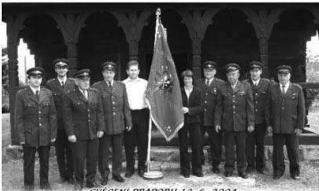
SVĚCENÍ PRAPORU 13. 6. 2004 SBOR DOBROVOLNÝCH HASIČŮ DOBŘÍKOV