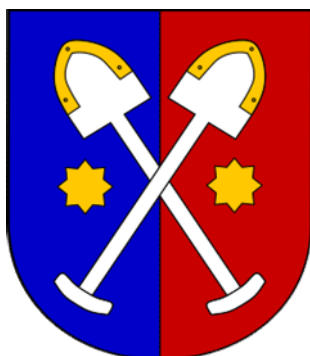
Obrázek č. 1.4.3: Znak - obec Dobříkov