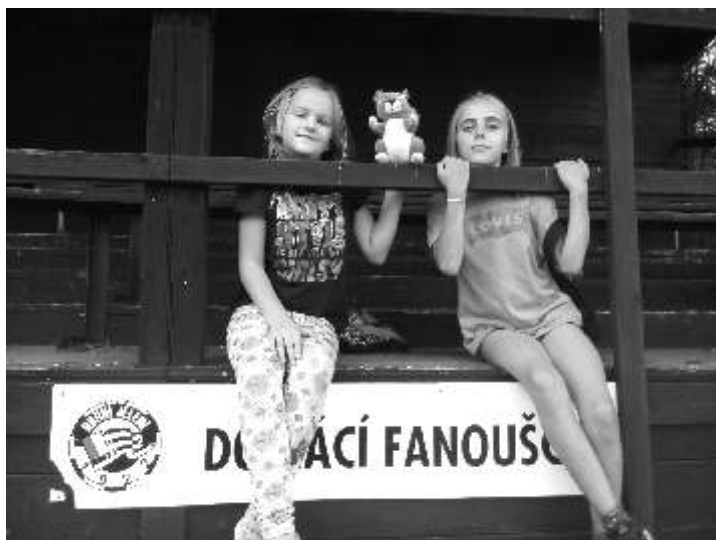
Více fotografií nalezne na webových stránkách školy www.zsDOBRIKOV.cz/fotogalerie-zs