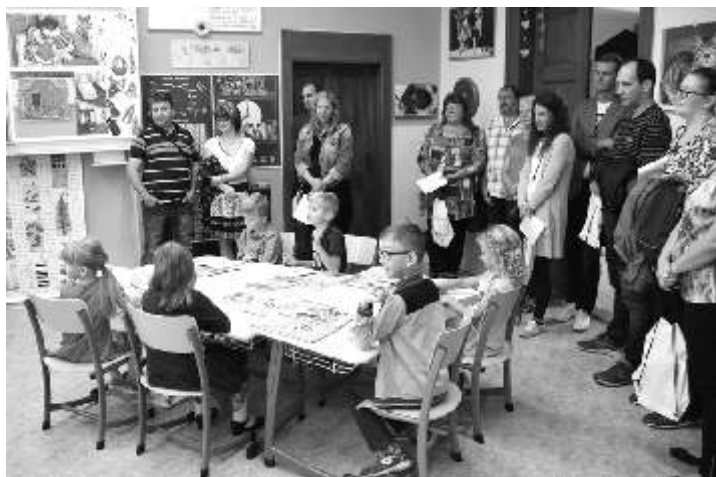
Více fotografií nalezne na webových stránkách školy www.zsdoebrikov.cz/fotogalerie-zs