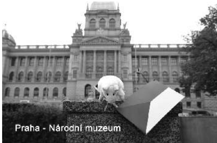
Praha - Národní muzeum