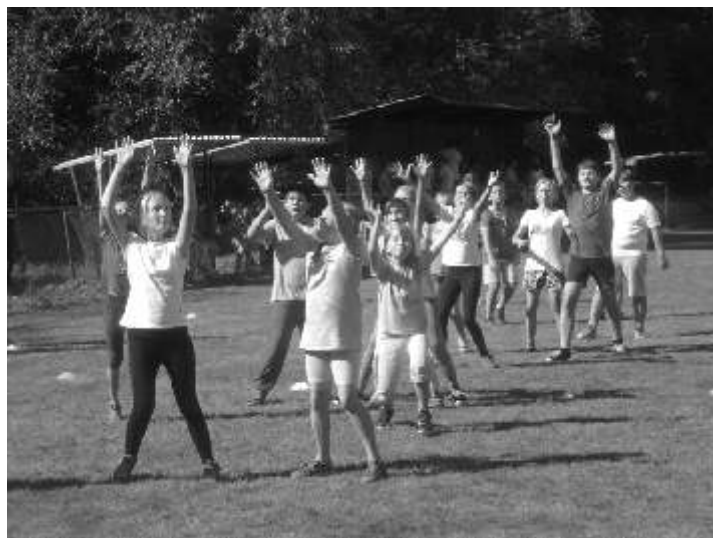
Více fotografií nalezne na webových stránkách školy www.zsdoebrikov.cz/fotogalerie-zs